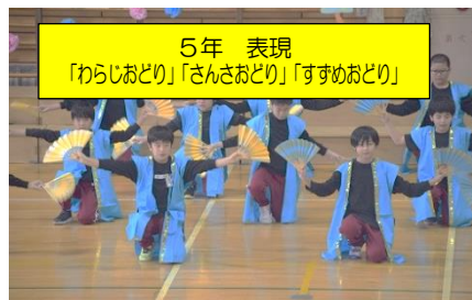
5年 表現 「わらじおどり」「さんさおどり」「すすめおどり」