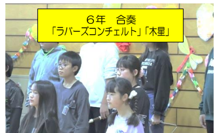
6年 合奏 「ラパースコンチェルト」「木星」