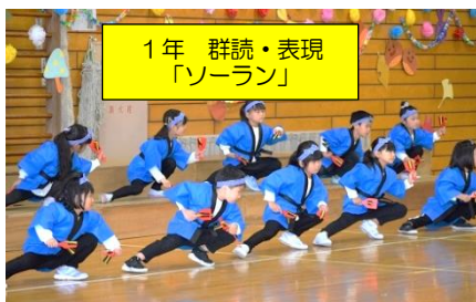
1年 群読・表現 「ソーラン」

今後とも、子供たちの健やかな成長のためになお一層のご理解・ご協力をお願いいたします。