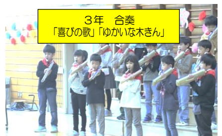
3年 合奏 「喜びの歌」「ゆかいな木ぎん」