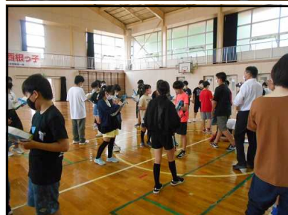
【第1回交流会】 (6/7西根小体育館にて)

人とかわりながら課題を解決していく力を育てることは、2020年度から実施されている新学習指導要領の趣旨の一つでもあります。情報化やグローバル化、人工知能の発達等、社会をめぐる変化が加速度的になっております。このような時代を生きる子供たちにとって、様々な人とかわりながら課題を解決する力は不可欠なものであると感じます。他者と協働しながら目の前の課題を解決することを通して、自分の可能性を広げ、未来を切りひらいていくことを願っております。