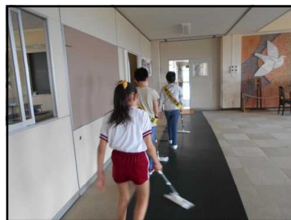
【校内清掃&あいさつ運動】 (5/20JRC委員会)

本校にはJRC委員会を含めて8つの委員会があります。それぞれの委員会では、学校生活が潤うようにと様々な工夫を凝らしながら活動に取り組んでいます。毎朝、明るい音楽とともに一日のスタートを告げてくれる放送委員会、石けんの補充や清潔調べを欠かさない保健委員会、学校を緑や花いっぱいにならせようとする草取りや水やりに取り組んでいる緑化委員会、この他にも計画、図書、保健、給食、体育の各委員会が常時活動やイベントを企画しながら活動しています。子供たちの日々の活動が北郷小の環境を整えてくれることを改めて感じました。